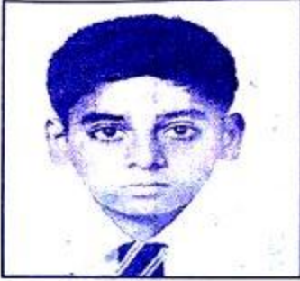
కంటె భార్గవ సాయి

తండ్రి. శ్రీ దత్తాది ఇ.నెం. 6-28/2, టి.వి. టవర్ కాలనీ, హన్మకొండ-వరంగల్.